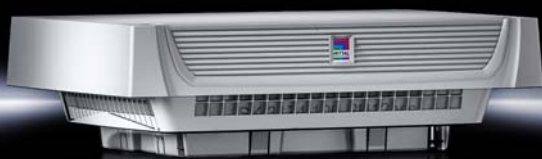
Tableau d'équivalence ventilateurs de toit