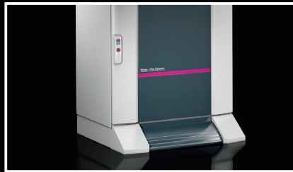
Neues modernes Industriedesign